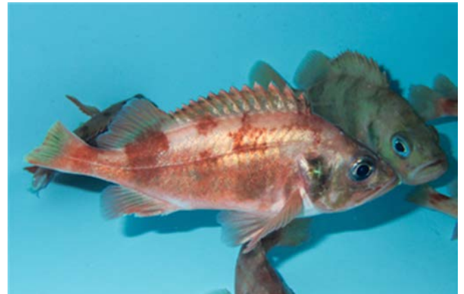
Quelques-uns des 800 Sébastes se trouvant dans la salle des bassins à l'Institut Maurice-Lamontagne, Pêches et Océans Canada, Mont-Joli, Québec